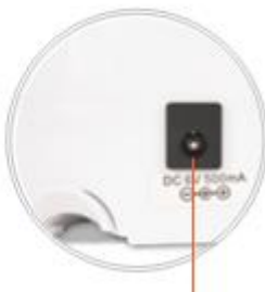
Вход за захранване

Резачката може да се използва без батерии, само със захранващ адаптер (не е включен в комплекта).